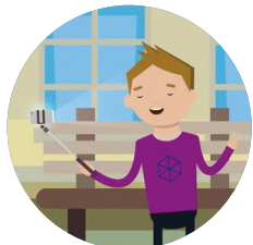
Social Media & Influencer