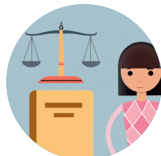
Rechte der betroffenen Person