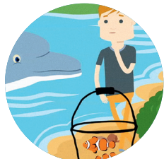
Internet & Phishing