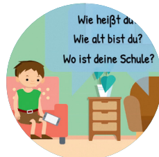
Preisgabe persönlicher Daten