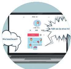
Hass im Netz